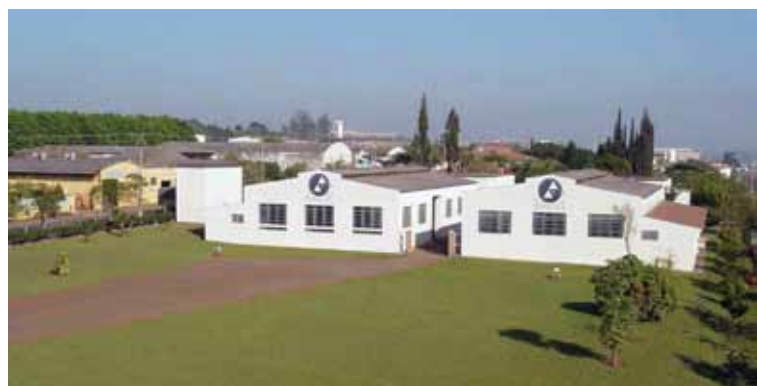
Unidade Industrial em Santa Gertrudes, interior de São Paulo

A principal finalidade dos produtos da Anhembi está em desempenhar o papel de vedação nos equipamentos, evitando vazamento de todo e qualquer tipo de fluido que circula durante seu funcionamento. A empresa disponibiliza gaxetas para pasteurizadores e resfriadores de leite, conhecidos como trocadores de calor e placas; diafragmas e membranas em silicone utilizados em equipamentos para envase de iogurte; guarnições para tanques rodoviários; estacionários e inspeção, retentores para desnatadeiras, rolhas para laboratório e anéis para conexões.