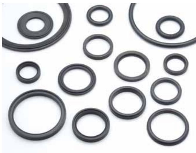
Anéis para conexões