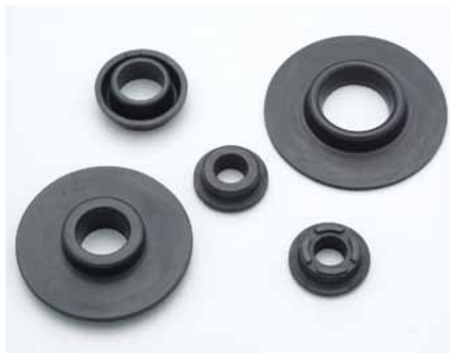
Retentores para desnatadeiras