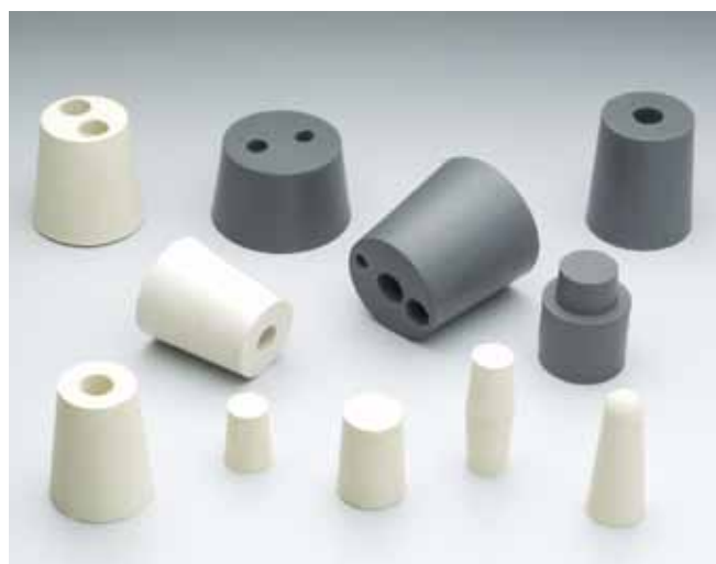
Rolhas para laboratório