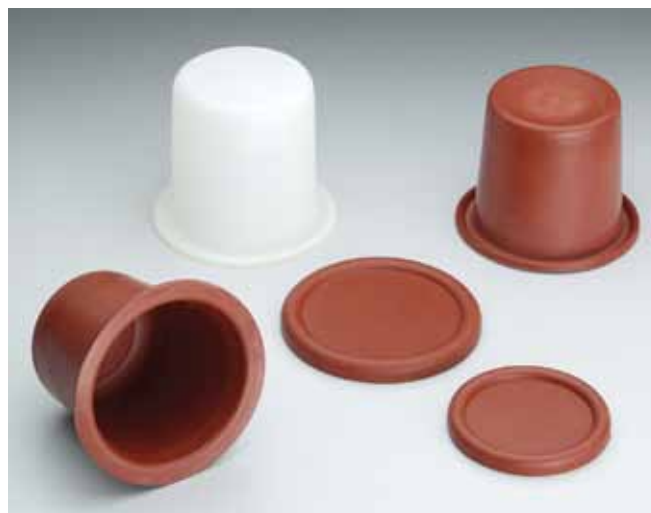
Diafragmas e membranas em silicone